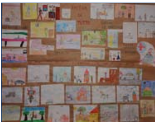
La vita del dott. Gastaldo raccontata dai bambini della scuola Gastaldo

Presentazione del libro e mostra sono poi state replicate, con molto