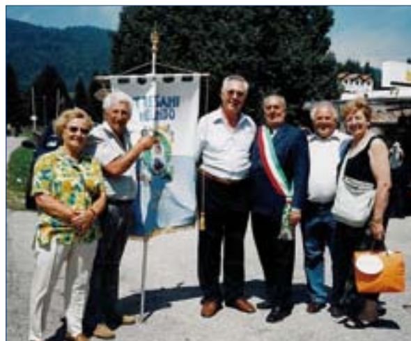
26 luglio 2009, Pian del Cansiglio. Raduno internazionale dell'Associazione “Trevisani nel Mondo”